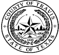
EXHIBIT A / ANEXO A